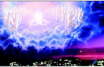
Дан. 2,34 „ДОКЛАД КАМЕНЬ... УДАРИЛ В ИСТУКАНА... В НОГИ ЕГО И РАЗБИЛ ИХ.“

Агнчие рога зверя отмечают молодость, невинность и мягкость и в точности представляют „ характер “ ранних Соединенных Штатов. Демократия и религиозная свобода („ два рога “) стали первыми фундаментальными положениями нации. Преследуемые папством в Европе христиане тысячами бежали в „ новый мир “ - Америку. Это было началом рождения США. Но зверь (США) с рогами, подобными агнчим,