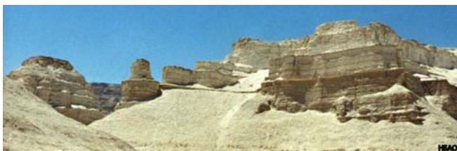
Внешняя стена Гоморры - типично хананейская двойная стена с пилястрами.

«И если города Содомские и Гоморрские, осудив на истребление, превратил в пепел, показав пример будущим нечестивцам» (2 Петра 2:6).