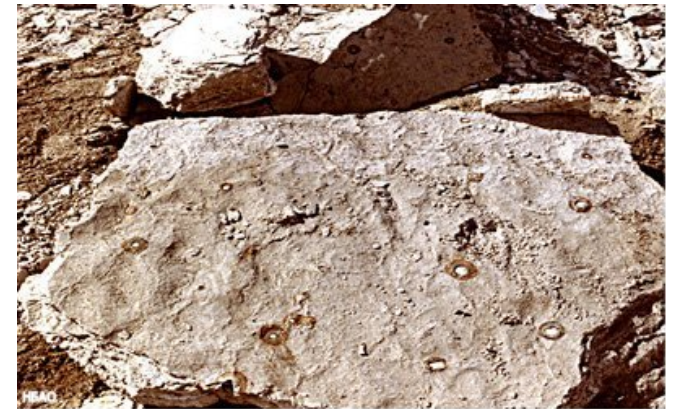
Большой кусок отвалившегося пепельного материала со множеством серных шаров внутри сожжённых капсул.

Материя сожжённой серы оставило пепел, который был тяжелее первоначально несожжённой материи, и это прояснило вопрос, почему пепел этих городов смог сохраниться в течение всех этих 3900 лет.