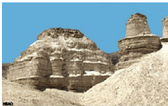
Круглый глян пепельных структур, которые напоминают храм и круглую башню.