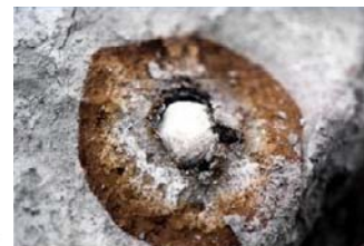
Вверху: серный шар в капсуле. Внизу: капсула с удалённым серным шаром.

серы. После того, как вещество полностью сгорало, к сере прекращался доступ кислорода, и потом происходила капсулизация. В каждой из этих кристаллообразных капсул имеются кусочки серы, размером напоминающие шарики подшипника. И миллионы таких шариков найдены в окружающем пепле. Некоторые были вскрыты и мы можем видеть серу внутри. Таких шариков здесь миллионы. Это явно указывает на то, что Бог излил дождём серу и пламя на эти города.